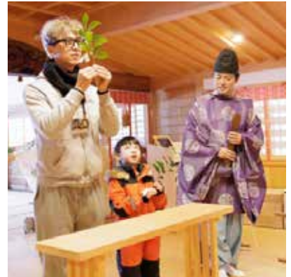
到着初日に執り行われる入郷式では神様に入郷報告と安全祈願を行う

主なターゲットは台湾や欧米の富裕層で、モニターツアーでは1人当たり約15～30万円と従来の平均消費額を大幅に上回る高付加価値化を実現した。収益は文化の継承に充てており、観光を通して地域の文化資源を経済価値へと転換させることで、持続性の高い地域経済の循環を構築している点が高く評価された。